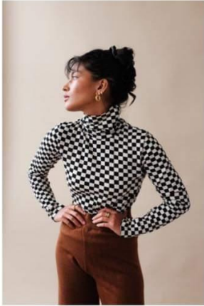
Kockás felső sakkozáshoz