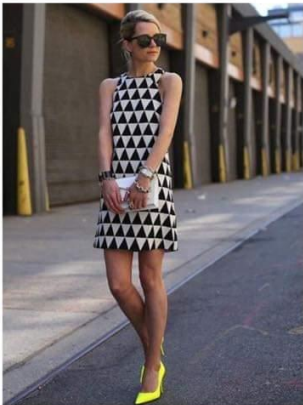
Háromszög mintás ruha pizza evéshez