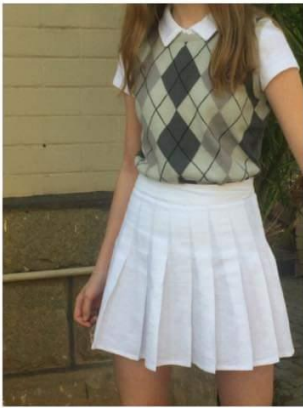
Rombusz mintás felső matematika órára