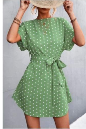
Pöttyös ruha labdázáshoz