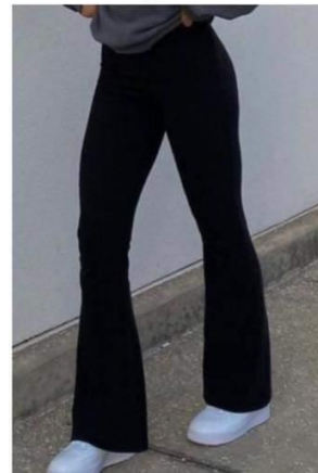
Trapéznadrág visszahozása a divatba