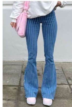
Párhuzamos csíkos nadrág kordinátageometriára